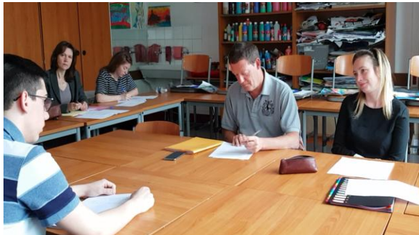
Oral d'un élève de 3ème