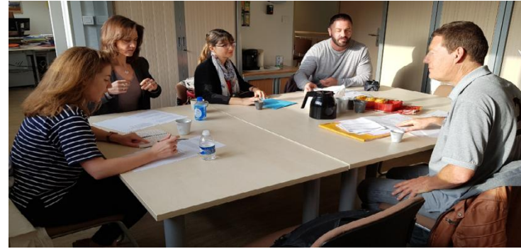
Briefing jurys oraux 3ème