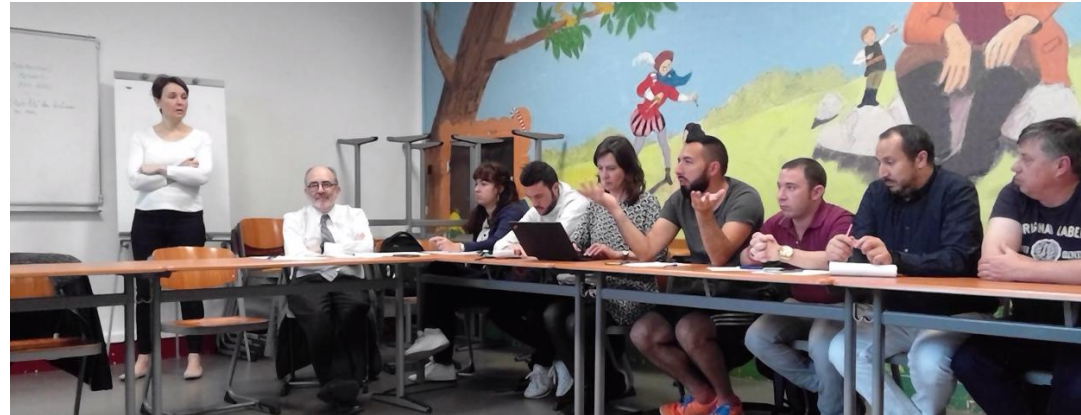
Conseil école-collège - Bilan des co-animations