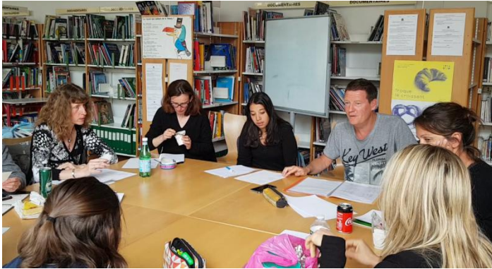
Réunion préparation oraux CM2